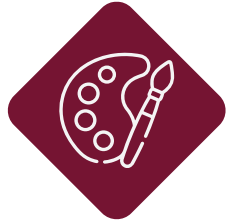
الأعمال الفنية Artistic works