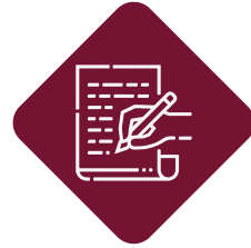
الأعمال المكتوبة Written Works