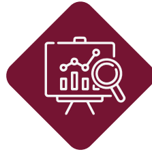
الأعمال التخطيطية Planning Works