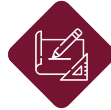
الأعمال المعمارية Architectural Works