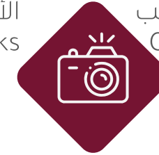
الأعمال الفوتوجرافية Photographic Works