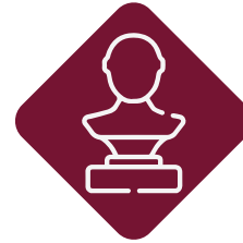
الأعمال المجسّمة Stereoscopic Works